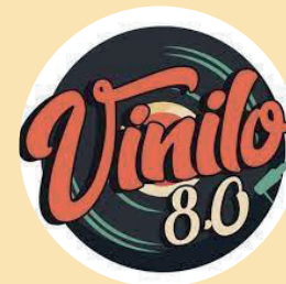
19:00 h. Grupo Musical Vinilo 8.0