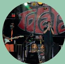
19:00 h. Grupo Musical Tocata Versiones