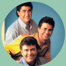
22:00 h. Los Requebros